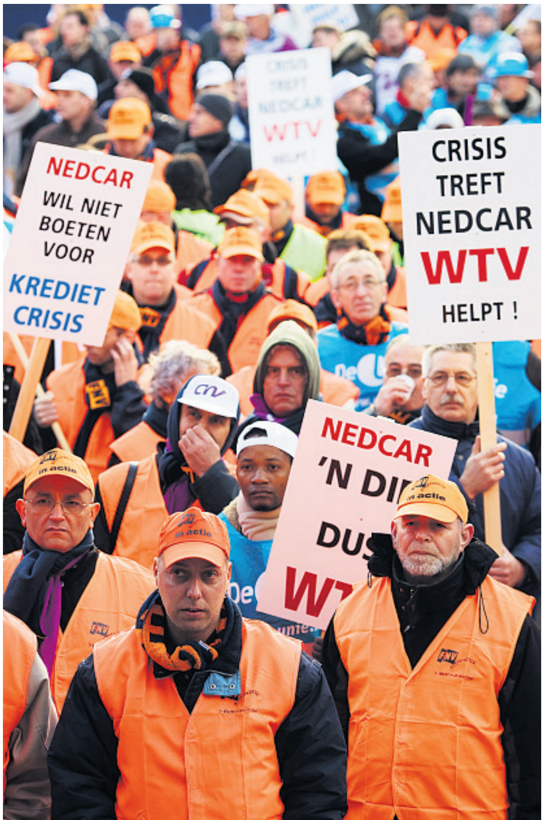
▲ Demonstratie Binnenhof, 21 november 2008