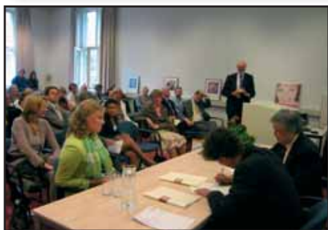
Diploma-uitreiking Master 11 juli 2007